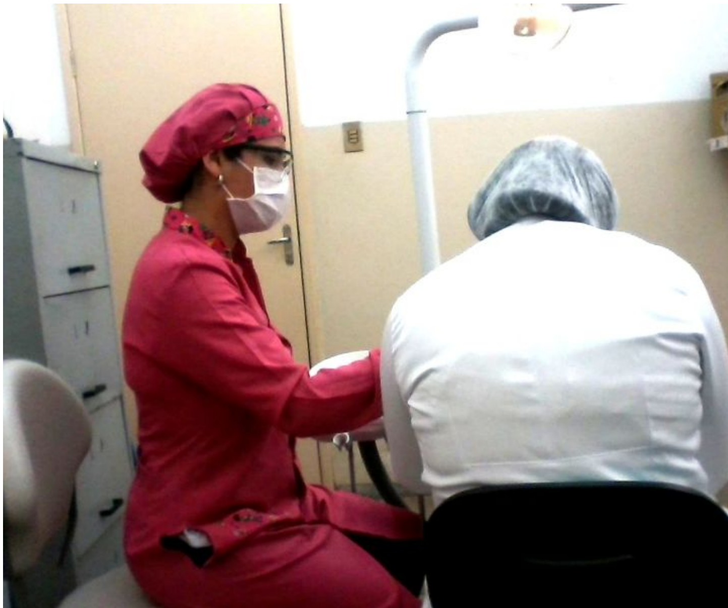
Figura 1. Acadêmicas durante atendimento odontológico em estágio supervisionado na ESF Antônio Pimenta II no mês de setembro de 2018.